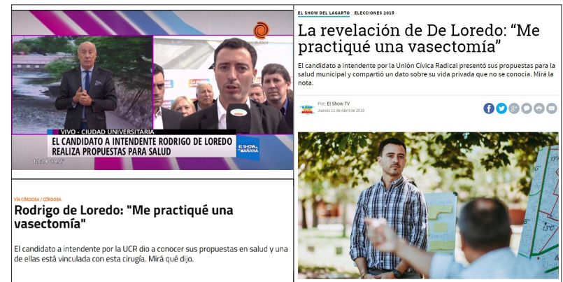
IMAGEN 8. Capturas de la cobertura de medios a la vasectomía realizada por De Loredo.