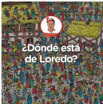
IMAGEN 11. Captura del video posteoado ¿Dónde está De Loredo? en Instagram