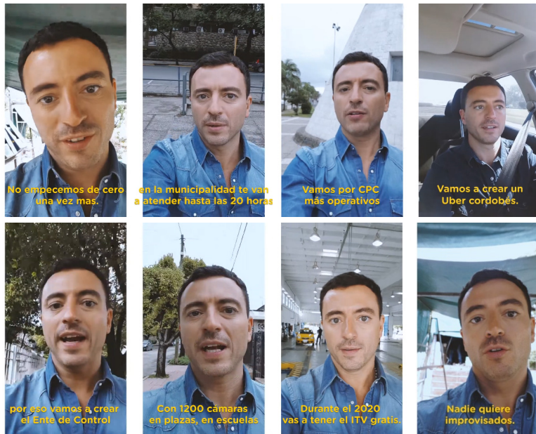
IMAGEN 7. Capturas de pantalla de Spots selfies