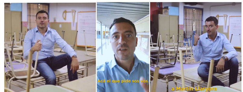
IMAGEN 16. “Pedido de voto”.