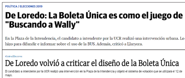
IMAGEN 10. Captura de la cobertura de medios de las críticas a la boleta única