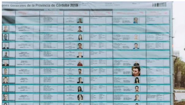
IMAGEN 9. Boleta gigante instalada en la Plaza de la Intendencia

Fuente: Prensa De Loredo. Tomada en Plaza de la Intendencia, Córdoba.