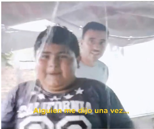
IMAGEN 17. Captura de video spot “Pusimos todo”