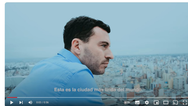
LA CIUDAD MÁS LINDA DEL MUNDO. #CórdobaEnPotencia