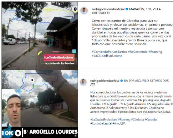
IMAGEN 13. Acción “¿Qué nos corre?”