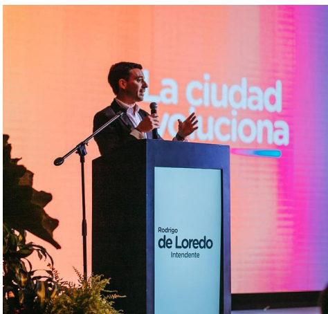
IMAGEN 5. Fotografía en cena de recaudación

Fuente: Instagram de Rodrigo de Loredo (De Loredo, 22 de marzo de 2019)