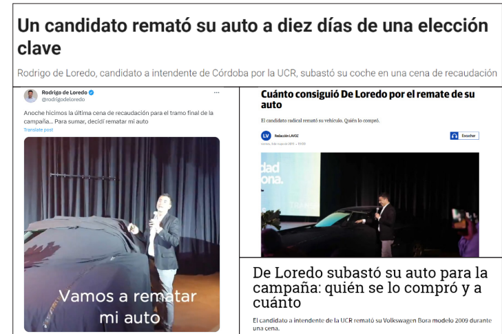
IMAGEN 15. Capturas de la subaste de su auto para recaudar fondos.