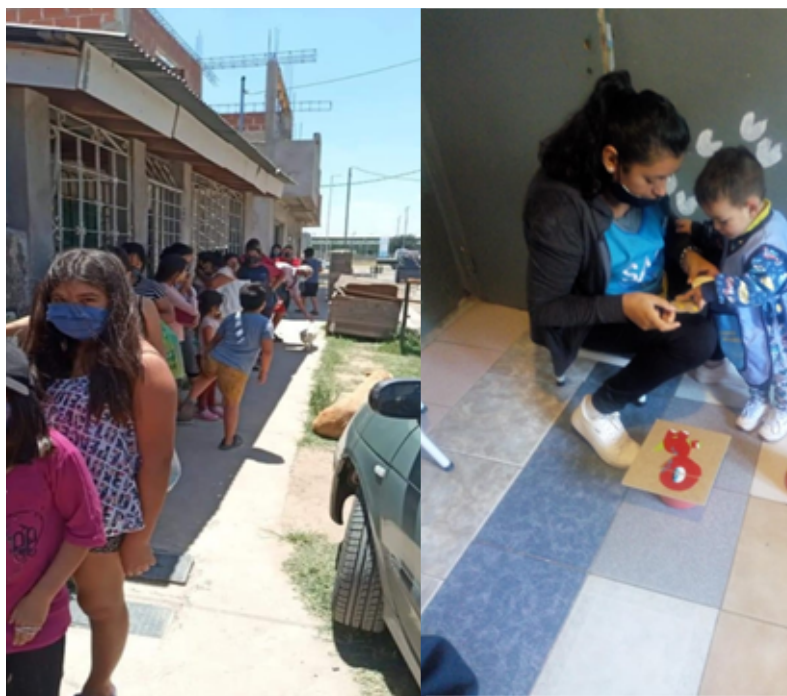
IMÁGENES: EL CUIDADO COLECTIVO Y EL CUIDADO INTERGENERACIONAL.

Los decires, haceres y sentires de las mujeres entrevistadas se desprenden de sus experiencias de cuidados, es decir, del cuerpo individual y colectivo que constituyen sus biografías.