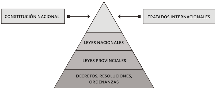
Figura 2. Estructura jerárquica del ordenamiento jurídico argentino

Nota: el gráfico representa la estructura jerárquica del ordenamiento jurídico que realiza Kelsen (2011), en cuya base se encuentran las normas de menor jerarquía y hacia la cúspide las de mayor, aplícale al ordenamiento argentino.