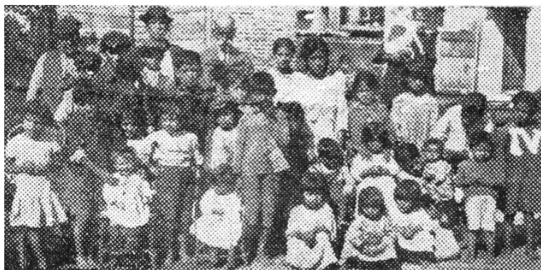
Imagen N°2. “Los futuros obreros de la patria que crecen entre el hacinamiento” así el diario describía a las infancias de los conventillos.