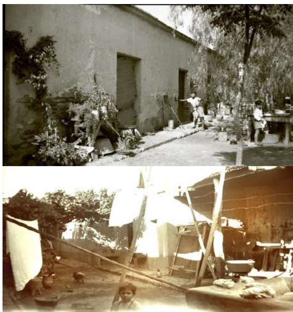
Imagen N°5 y N°6. Los “afueras” de algunas viviendas.