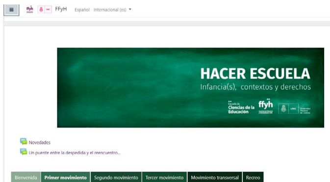
Portada Aula Virtual de la Práctica Sociocomunitaria