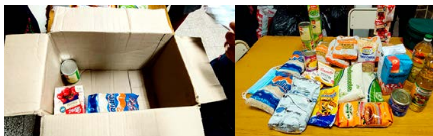
Fotografías: Carla Pedrazzani, mayo de 2021

Asimismo, atendiendo a la situación crítica del frío en el barrio y en las escuelas, decidimos relanzar la Campaña “ El Cuidado es Colectivo ” para recolectar ropa de abrigo, mantas, colchas y abrazar así a las niñeces, porque también “ el abrigo es colectivo ”. Una vez más nos emocionamos por las redes que se agrandan y se multiplican. En estos gestos, en estas acciones que se vuelven una pulsión vital donde sucede un entramado de redes que generan territorios reticulares desde donde se apuesta a una micropolítica de cuidado colectivo, se renuevan las cercanías, la defensa de que el distanciamiento no es social, sino físico como medida sanitaria hasta que se apacigüe la propagación del virus de esta pandemia.