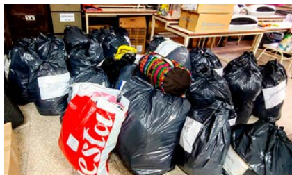
Fotografías: Carla Pedrazzani, mayo de 2021.

Apostamos a seguir construyendo una voz y un cuerpo colectivos que se hagan vitales entre preguntas y tensiones que orientan el accionar, frente a una profundización de la lógica individualista en un mundo neoliberal y desigual, aunque eso signifique que las cartografías transitadas y las que hay que proyectar, se muevan e inviten a ser renovados terrenos fértiles.