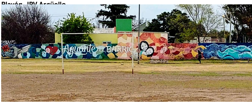
2019, en el marco del 1er. recorrido del seminario-taller de la PSC.

Para nombrar, visibilizar, denunciar y anunciar la profundización de las injusticias y desigualdades preexistentes a la pandemia, y las que se agudizaron con ella, como equipo extensionista que nos reconocemos con y parte de la Mesa de Organizaciones Argüello, hacia finales de marzo y principios de abril de 2020 construimos y difundimos la campaña "El cuidado es colectivo" 6 . Desde el hacer colectivo, nos potenciamos y aliamos en un sentir-pensar conjunto de lo que es necesario, emergente y urgente en las barriadas populares. La Campaña motorizó una colecta de alimentos no perecederos, de medicamentos, de artículos de limpieza y