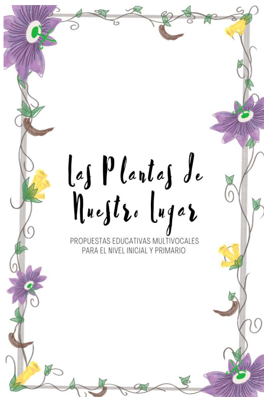
Figura 3. Portada de la publicación “Las plantas de nuestro lugar: propuestas educativas multivocales para el nivel inicial y primario”. La misma está disponible para descarga en el blog:

Muchas de estas producciones fueron recopiladas en la publicación “Las plantas de nuestro lugar. Propuestas educativas multivocales para el nivel inicial y primario” (Muñoz Paganoni et al., 2021) (Figura 3).