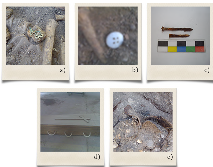
Figura 3. Materiales asociados a los entierros: a) Ganchos metálicos para sujeción de tela. b) botones de vidrio fabricados a partir de 1830. c) Clavos importados de Estados Unidos a partir de 1880. d) Ataúd trapezoidal fabricado hasta 1960. e) Zapatos de mujer (Uribe, 2011).

Esta información se complementa con la investigación recientemente publicada, realizada por Ramírez, Nores y Saka (2021), quienes, a través de análisis paleogenéticos, detectaron la presencia de trazas de ADN antiguo de la bacteria Vibrio cholerae , causante del cólera, en sedimentos del sacro de, al menos, un individuo. 3