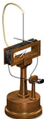
Fig. 1: Representación del multiplicador de Johann Schweigger.

En el caso del multiplicador de Schweigger (fig. 1) se coloca una aguja magnetizada para contrarrestar el efecto del campo magnético terrestre. El sistema de Schweigger logra amplificar o multiplicar el efecto de una corriente eléctrica sobre una aguja magnetizada. En la medida que se hicieran más giros del cable conductor alrededor del marco de madera se lograba un efecto magnético mayor sobre la aguja magnetizada y permite medir y trabajar con corrientes débiles como las que ya habíamos descrito en los sistemas electroquímicos. La deflexión de la aguja es considera-